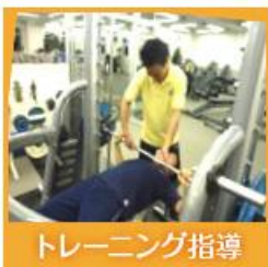
トレーニング指導