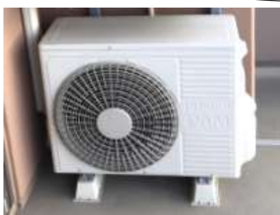
エアコン洗浄（室外機） 1台 5,400円（税込） 単品7番