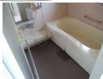
浴室カビ取り清掃（防カビプラス） 12,960円（税込） 単品4番