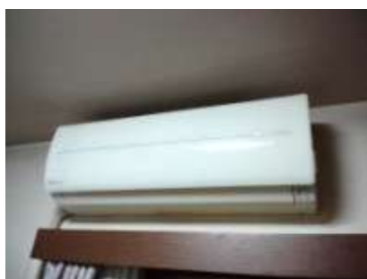
エアコン分解洗浄（室内機） 1台 10,800円（税込） 単品6番